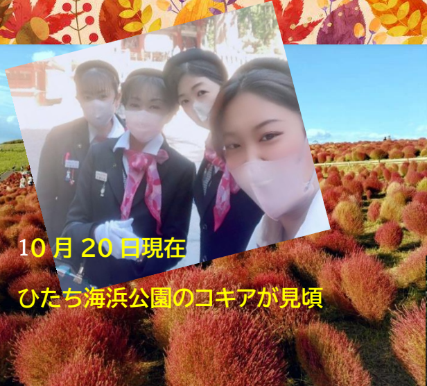
10月20日現在 ひたち海浜公園のコキアが見頃

富士山が10月5日朝、雪化粧した姿を見せました。 甲府地方気象台は「初冠雪」を発表。平年より3日、昨年より5日遅く 猛暑だった夏から一転し、早くも山は冬の装いとなりました