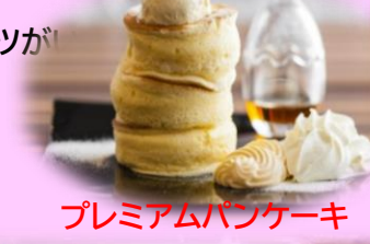
プレミアムバンケーキ

常陸牛や県産さつまいも、オリジナル卵にメロンも楽しめます♪ 豪華グルメ&スイーツが 食のテーマパーク