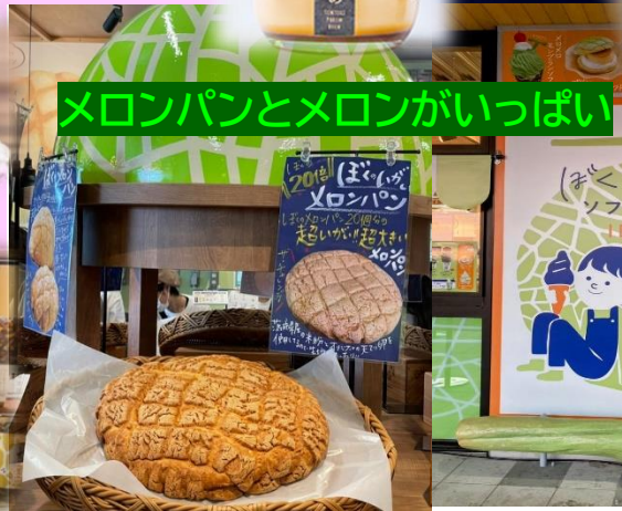
メロンパンとメロンがいっぱい