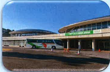
北浜松総合体育館サーラグリーンアリーナにて

まん延防止等重点措置延長に伴い、観光地には御一行様やツアーはまだ多くないようですが、弊社は先月半ば頃から大変有難いことに学生さんの仕事やモニターツアーなどお仕事を頂き各地へバスが動いています。卒業を目の前にやっと修学旅行に行くことができた生徒さんの笑顔を見ると私たちが嬉しくなります。春はすぐそこまで来ています。桜の開花を待ちわびながら仕事があることに感謝しながら本日も安全運転で走行してまいります。