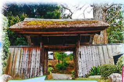
松戸市にある戸定邸

戸定邸は徳川昭武（最後の将軍徳川慶喜の弟）の別邸 明治17年に完成・・・至るところに葵三つ葉が見られ、 幻の将軍と呼ばれる昭武公の美学が反映された気品に 満ちた趣を感じます。