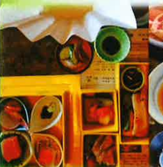
戸定邸ゆかりの昭武公と慶喜公の好物を 御膳にした戸定御膳

5J珈琲子-コ-と24分煎の玉葉 豆を焙煎し公認珈琲師の手で30分 煎す珈琲の土曜 コーヒー選5J-1 nobynob OXUMI 農工士研 マカロン 珈琲