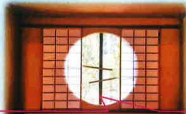
外とは隙子1枚で仕切られた丸窓 も見どころの一つでステキです