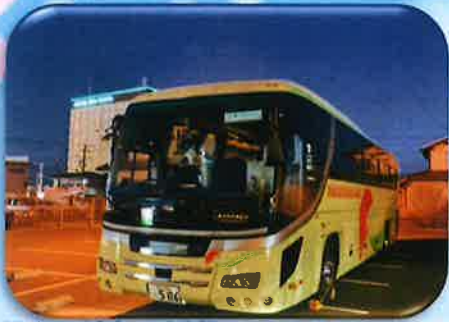
試合の遠征で浜松へ・・・