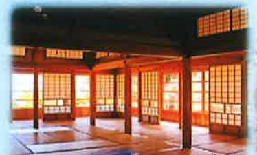
純和風の建物内は9棟が廊下で結ばれ 23の部屋がある。来客用の「表」と 家族と使用人の「奥」に区別されている