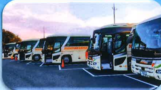
モニターツアー 「道の駅しょうなん」にバス集合

まん延防止等重点措置延長に伴い、観光地には御一行様やツアーはまだ多くないようですが、弊社は先月半ば頃から大変有難いことに学生さんの仕事やモニターツアーなどお仕事を頂き各地へバスが動いています。卒業を目の前にやっと修学旅行に行くことができた生徒さんの笑顔を見ると私たちが嬉しくなります。春はすぐそこまで来ています。桜の開花を待ちわびながら仕事があることに感謝しながら本日も安全運転で走行してまいります。