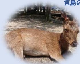
宮島のシカちゃん♥

首脳陣をお客様として乗せたあの時の緊張感を忘れずに、 今後も安全運転に努めてまいります。